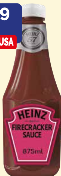
FIRECRACKER SAUCE HEINZ