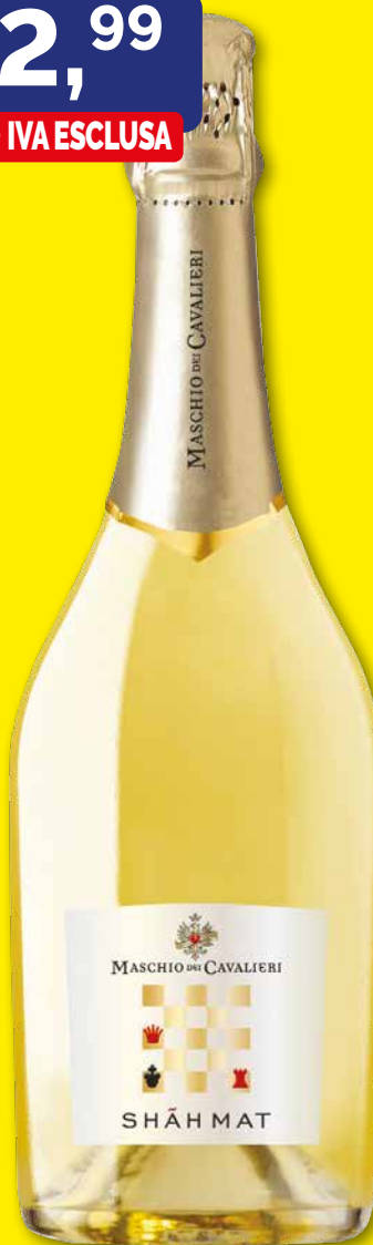
SPUMANTE MASCHIO DEI CAVALIERI SHãH MAT EXTRA DRY confezione da 6 bottiglie 75 cl