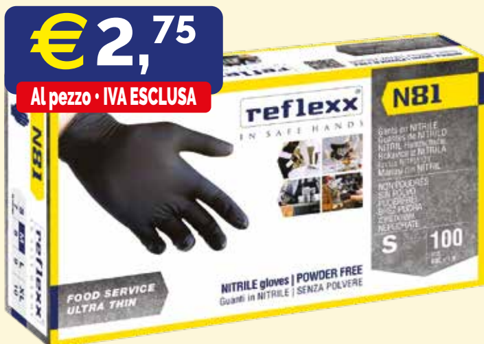
GUANTI MONOUSO IN NITRILE REFLEXX N81 SMALL NERE 100 pezzi