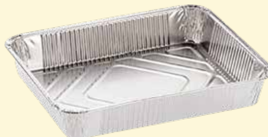
VASCHETTE IN ALLUMINIO 4 PORZIONI 100 pz..