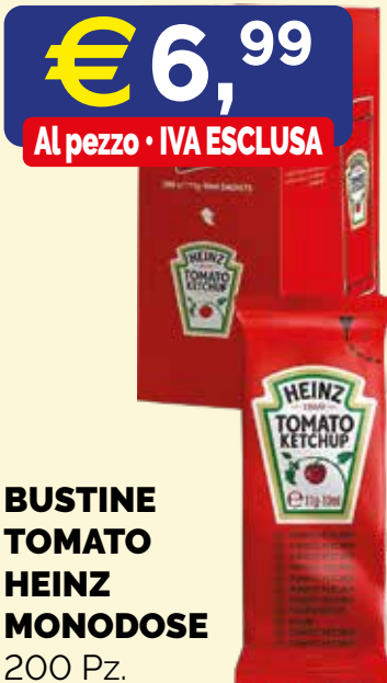
BUSTINE TOMATO HEINZ MONODOSE 200 Pz.