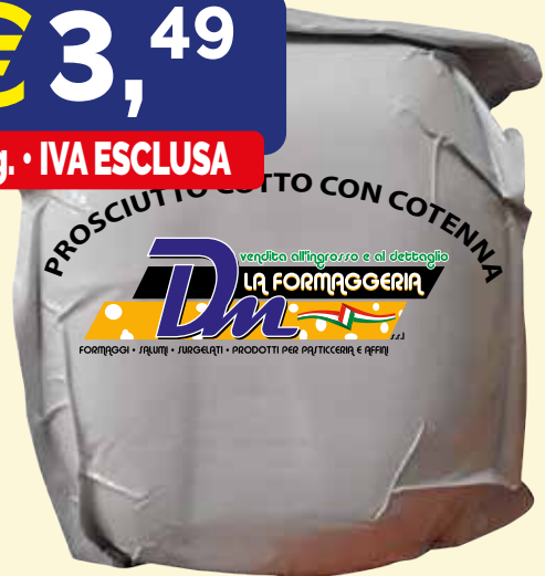
PROSCIUTTO COTTO COSCIA CON COTENNA LA FORMAGGERIA DM kg. 9