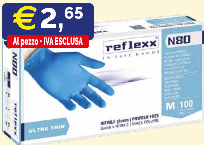
GUANTI MONOUSO IN NITRILE REFLEXX N80B MEDIUM 100 pezzi