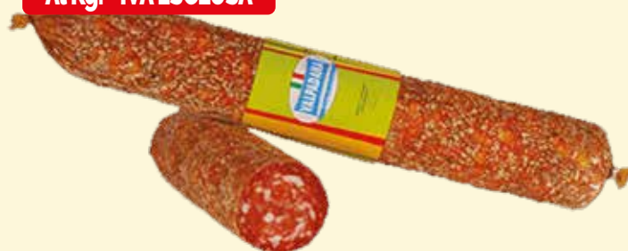
SALAME NAPOLI VALPADANA kg. 1