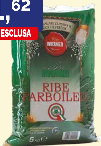
RISO RIBE PARBOILED INVERNIZZI busta Kg. 5X3