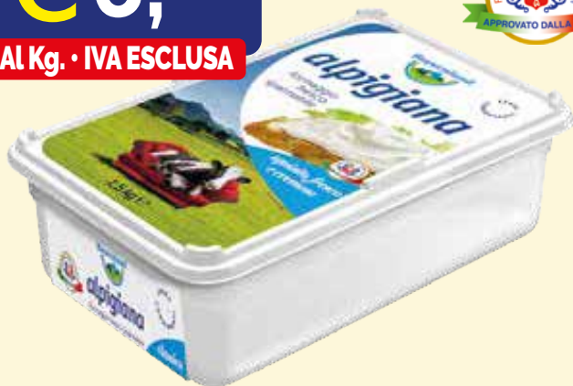
BAYERNLAND ALPIGIANA FORMAGGIO FRESCO kg. 1,5