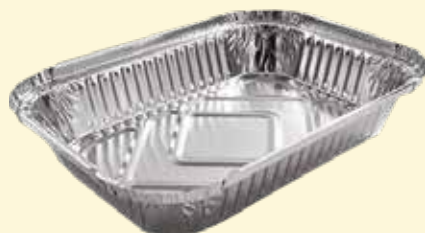
VASCHETTE IN ALLUMINIO 2 PORZIONI 100 pz..