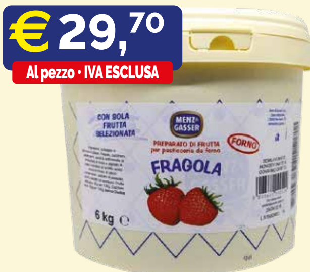
MARMELLATA FRAGOLA DA FORNO MENZ & GASSER Secchio kg. 6