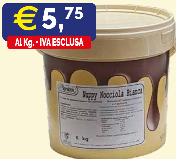
NUPPY NOCCIOLA BIANCA CREMA SPALMABILE con 12% nocciole italiane Secchio kg. 6