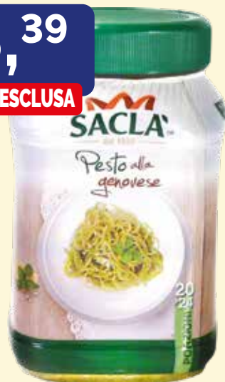
PESTO ALLA GENOVESE SACLÀ vaso da gr. 950