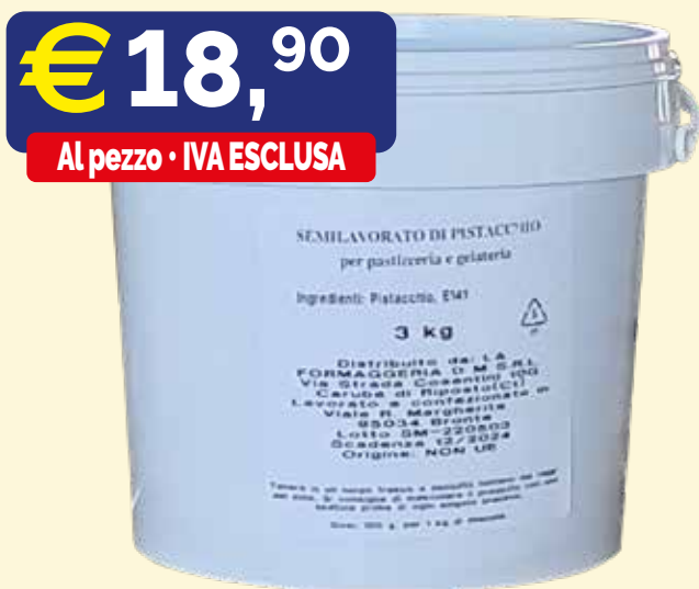
SEMILAVORATO DI PISTACCHIO 100% PURO "LA FORMAGGERIA DM" con 141 - Secchio kg.3