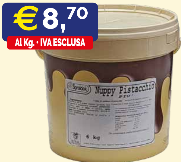
NUPPY PISTACCHIO PIÙ CREMA SPALMABILE Crema al 15% di pistacchio. Secchio kg. 6