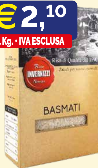
RISO BASMATI INVERNIZZI scat. kg. 1x10