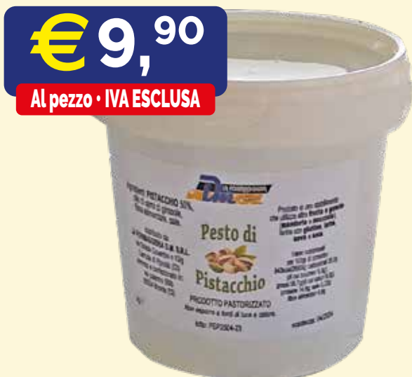
PESTO DI PISTACCHIO "LA FORMAGGERIA DM" kg. 1