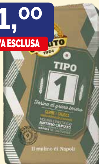
FARINA "TIPO 1" DI GRANO TENERO GERME E CRUSCA W 270 CAPUTO conf. da kg. 25