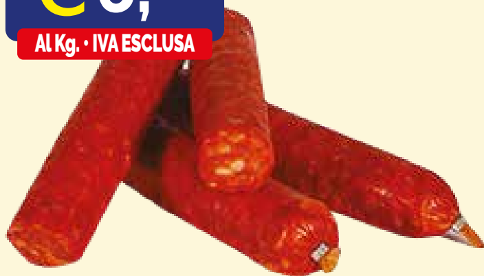
SALSICCIA PICCANTE NAPOLI BASTONE VALPADANA 4 pz