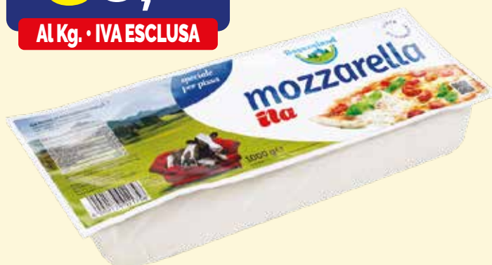
ILA FILONE MOZZARELLA BAYERNLAND kg. 1