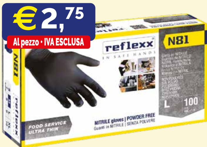
GUANTI MONOUSO IN NITRILE REFLEXX N81 LARGE NERE 100 pezzi