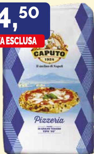
FARINA PIZZERIA DI GRANO TENERO BLU TIPO "00" W 280 CAPUTO conf. da kg. 25