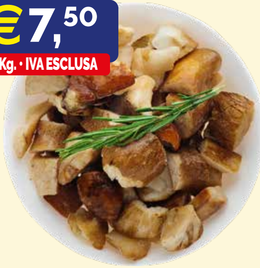
FUNGHI PORCINI CLASSE A CUBO SURGELATI PRIMA SCELTA kg 1