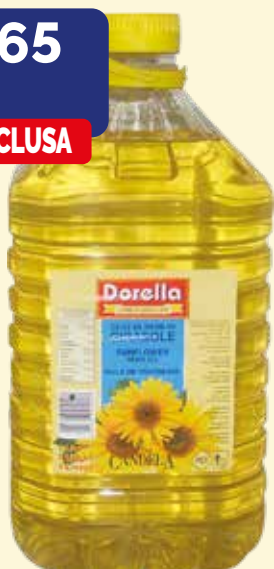
OLIO DI SEMI DI GIRASOLE DORELLA bidone da 5 lt