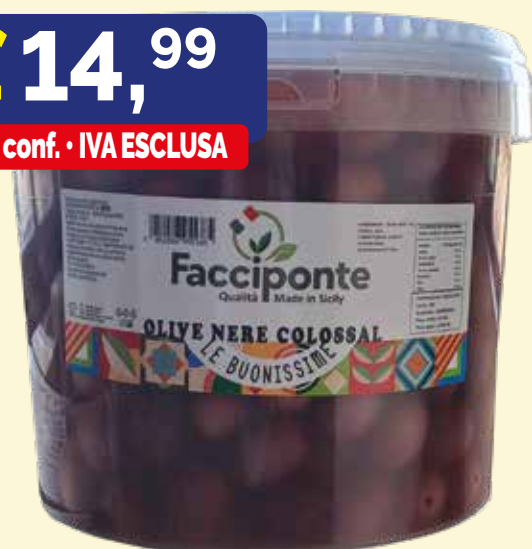
OLIVE NERE COLOSSAL FACCIPONTE kg. 5,5