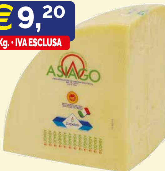
ASIAGO A QUARTI BIANCO ZARPELLON sottovuoto kg. 3