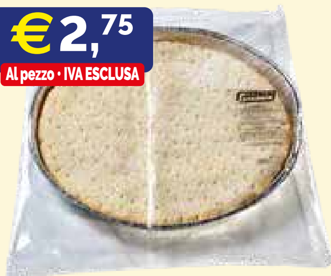
BASE PIZZA PRECOTTA SENZA GLUTINE SURGELATA SPADONI gr 280 X 6 pezzi