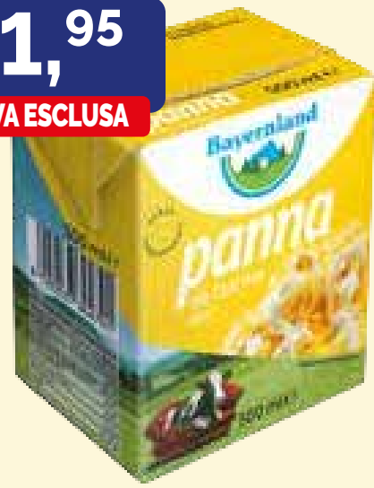
PANNA DA CUCINA UHT BAYERNLAND lt. 0,5