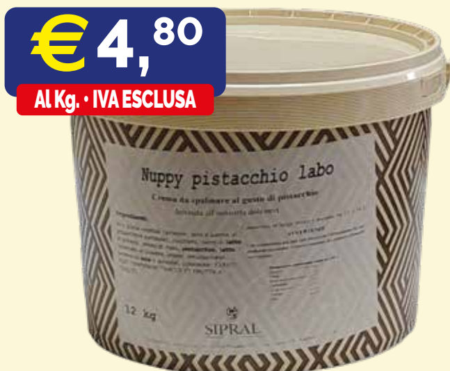
NUPPY PISTACCHIO PV S CREMA SPALMABILE Secchio kg. 12