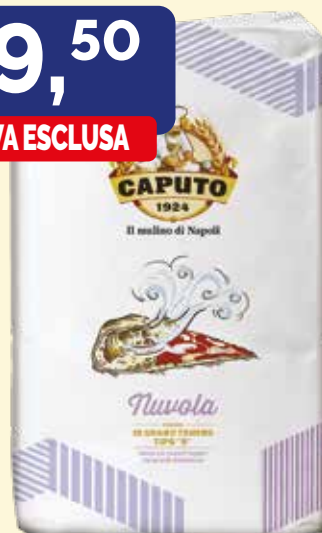
FARINA NUVOLO DI GRANO TENERO TIPO "0" W 280 CAPUTO conf. da kg. 25