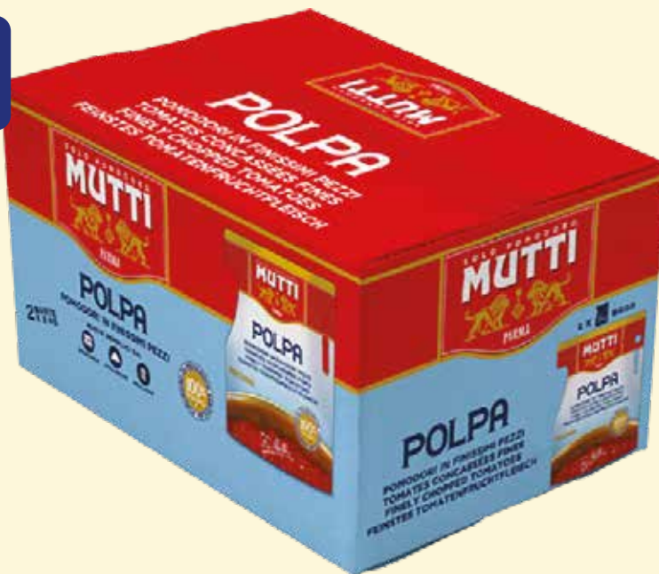
POLPA MUTTI bag box 5 kg X 2