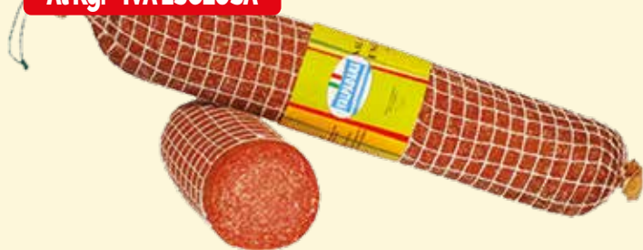
SALAME UNGHERESE VALPADANA kg. 3