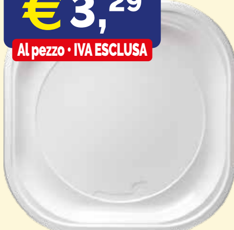
PIATTO QUADRATO IN POLPA DI CELLULOSA FLORIDA mm. 230x20 pz.