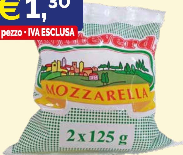
MOZZARELLA DI LATTE MONTEVERDI JAGER gr. 125X2