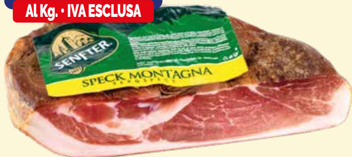
SPECK DI MONTAGNA SENFTER