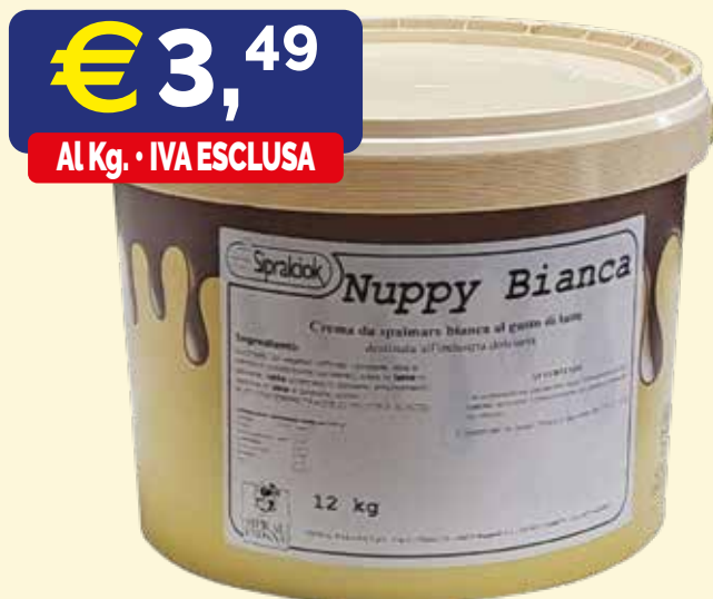
NUPPY BIANCA CREMA SPALMABILE AL GUSTO DI LATTE Secchio kg. 12