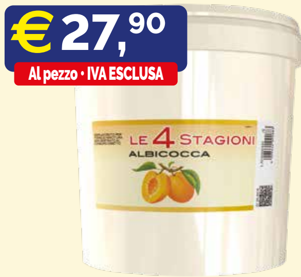
MARMELLATA LE 4 STAGIONI ALBICOCCA Secchio kg. 12,5