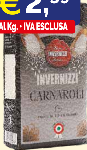
RISO CARNAROLI INVERNIZZI kg. 1 X 10