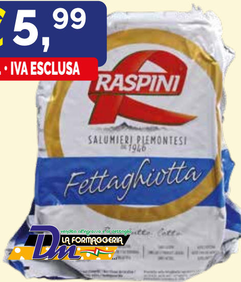
PROSCIUTTO COTTO DI COSCIA INTERO RASPINI kg.8