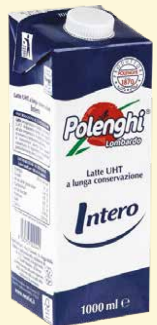
LATTE POLENGHI INTERO lt. 1