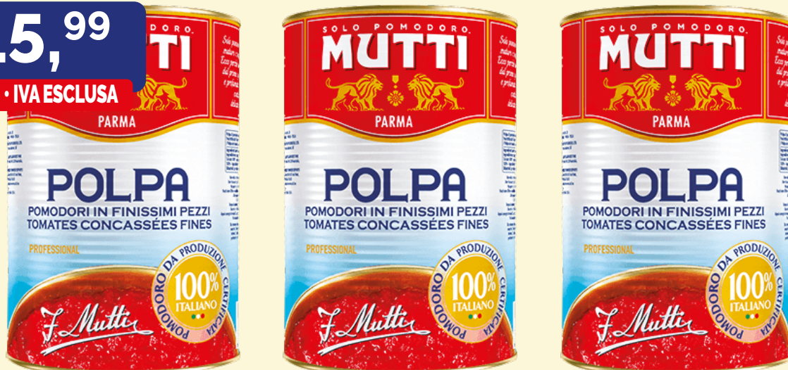
POLPA DI POMODORO MUTTI confezione gr. 4,050X3