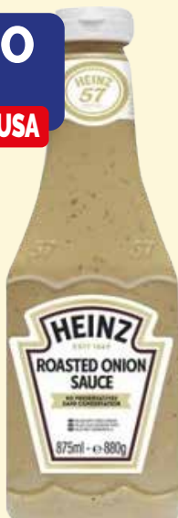
ROASTED STEACK & ONION HEINZ