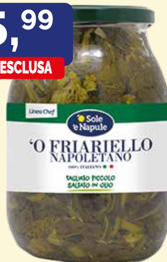
FRIARIELLI NAPOLETANI O SOLE E NAPULE gr. 960