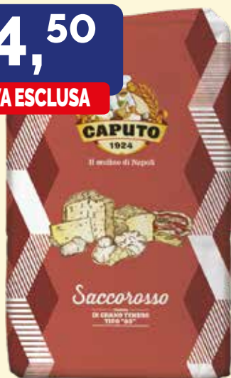
FARINA SACCOROSSO DI GRANO TENERO TIPO "00" W 320 CAPUTO conf. da kg. 25