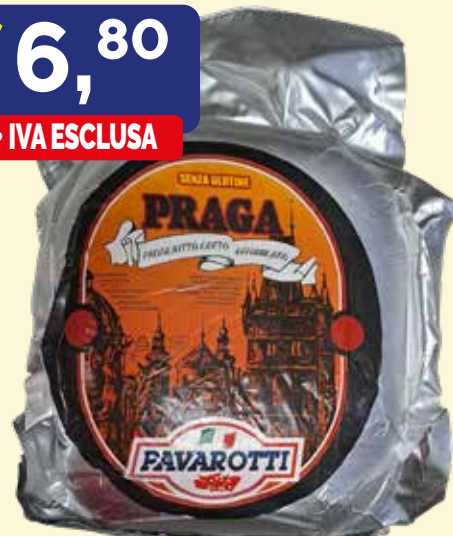
PROSCIUTTO COTTO PRAGA PAVAROTTI