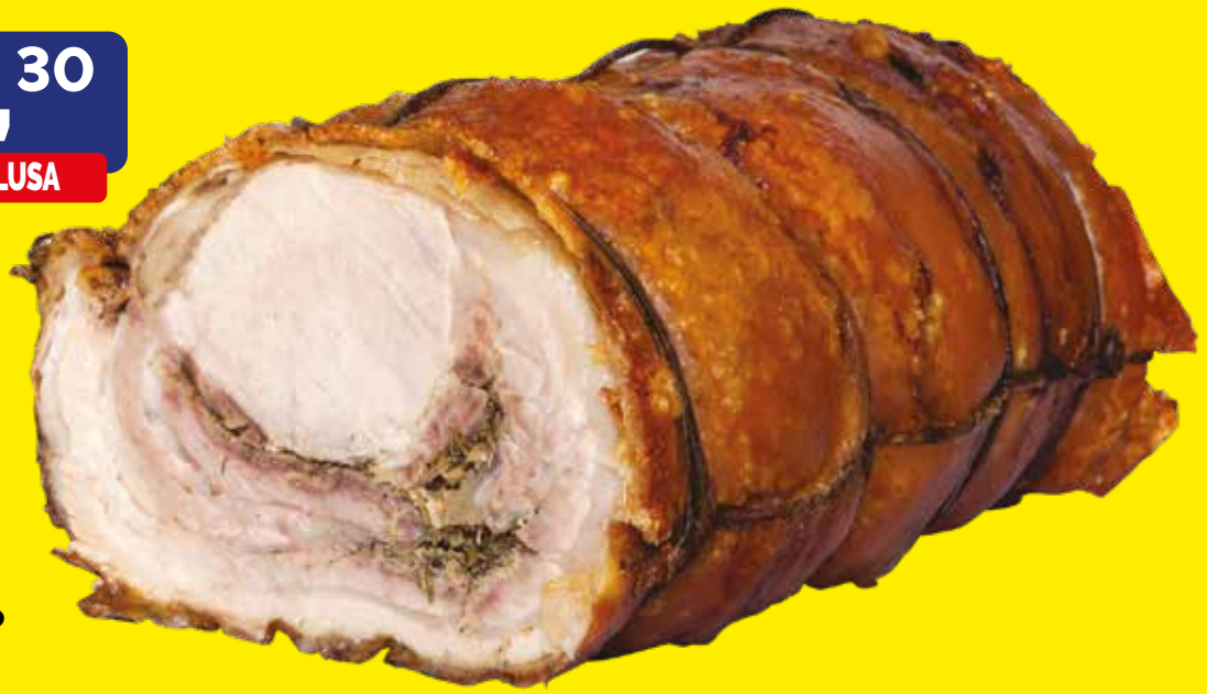
PORCHETTA DI ARICCIA I.G.P ITALPORKETTA