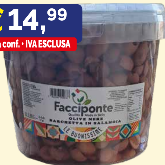
OLIVE NERE A BARCHETTA FACCIPONTE kg. 5,5