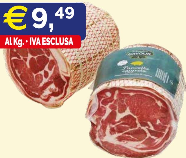
PANCETTA COPPATA DEL NONNO SALUMIFICO CAVOUR kg. 1,9