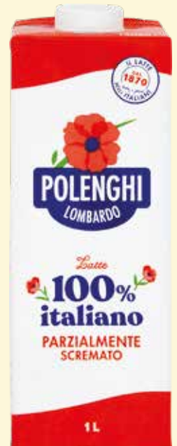
LATTE POLENGHI PARZIALMENTE SCREMATO lt. 1