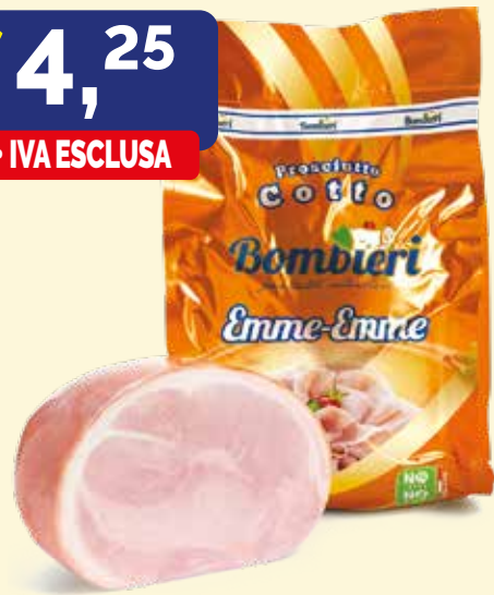
PROSCIUTTO COTTO EMME EMME BOMBIERI