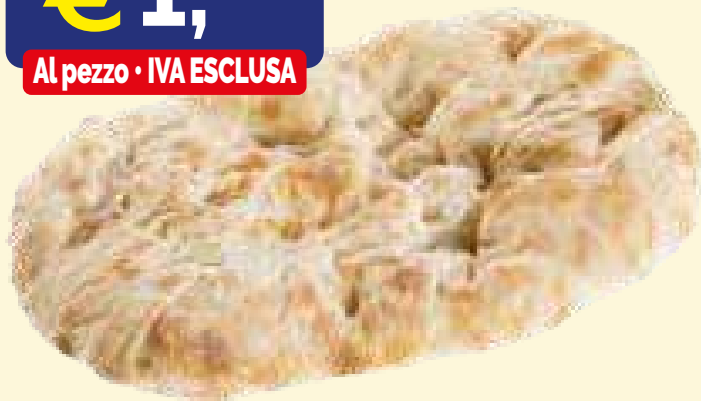
PINSA SURGELATA SPADONI 29X19 gr 210 X 12 pezzi