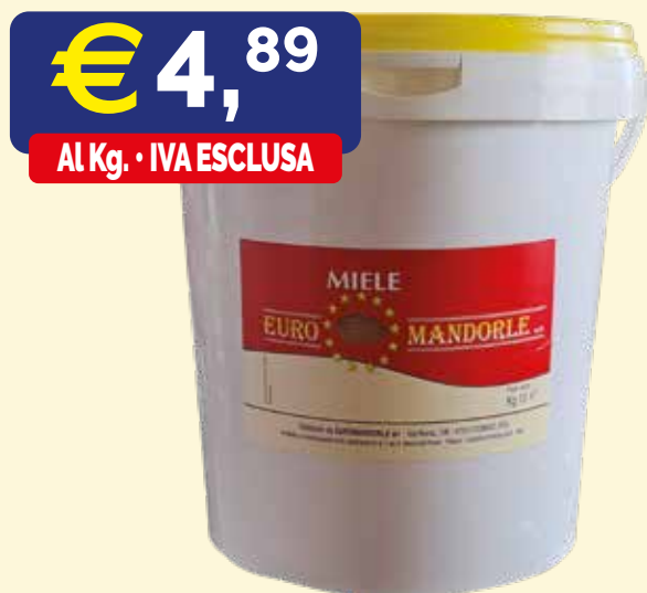
MIELE MILLEFIORI EURO MANDORLE secchio da kg 10