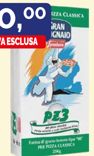
FARINA PZ3" PER PIZZA CLASSICA SPADONI kg. 25