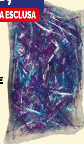
FORCHETTE PLASTICA PER PATATINE A DUE PUNTE FLORIDA 1000 pezzi