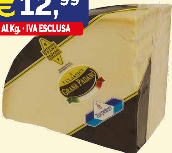
GRANA PADANO DOP IN OTTAVI ZARPELLON kg. 5