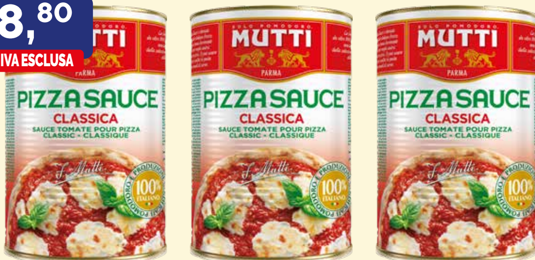
PIZZA SAUCE CLASSICA MUTTI confezione gr. 4,100X3