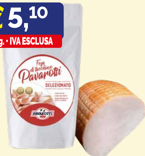
FESA DI TACCHINO SILHOUETTE PAVAROTTI