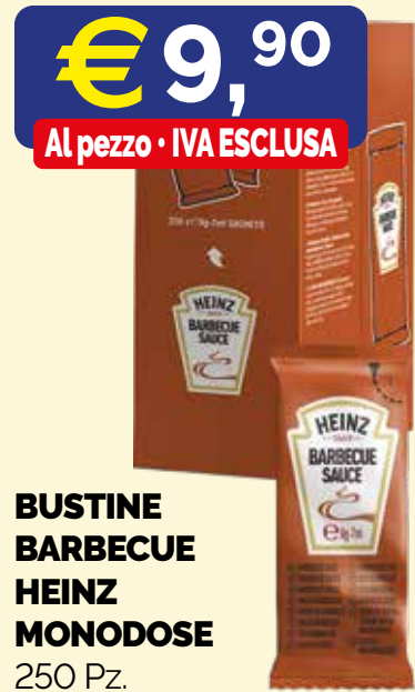
BUSTINE BARBECUE HEINZ MONODOSE 250 Pz.