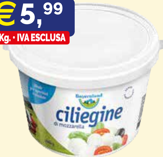
MOZZARELLA CILIEGINE BAYERNLAND kg. 1