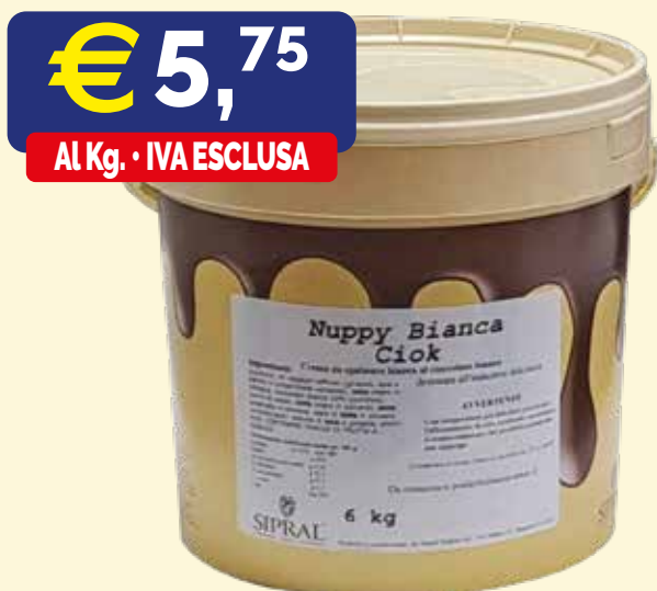
NUPPY BIANCA CIOK CREMA SPALMABILE AL CIOCCOLATO BIANCO Secchio kg. 6