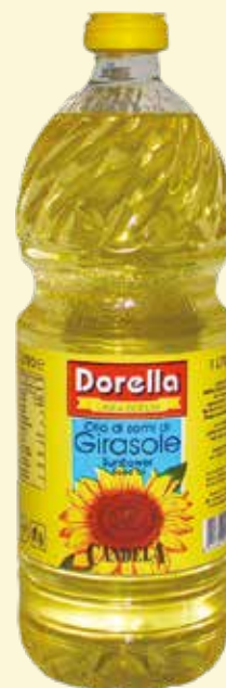
OLIO DI SEMI DI GIRASOLE DORELLA lt. 1