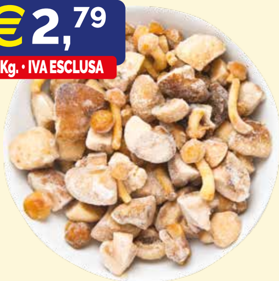
MISTO FUNGHI CON PORCINI SURGELATI