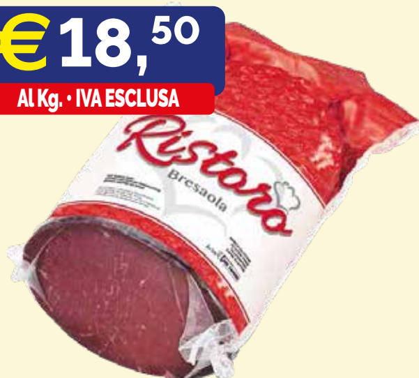
BRESAOLA PUNTA D'ANCA "RISTORO" RIGAMONTI kg. 1,5