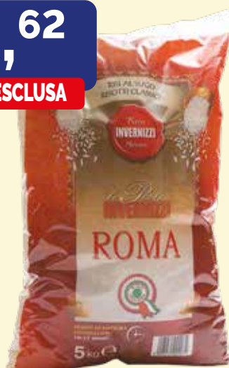
RISO ROMA busta Kg. 5X3