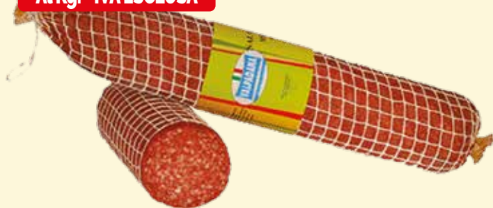
SALAME MILANO VALPADANA kg. 3