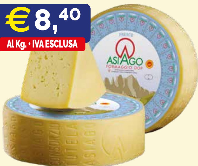
ASIAGO A FORMA INTERA BIANCO ZARPELLON kg. 12