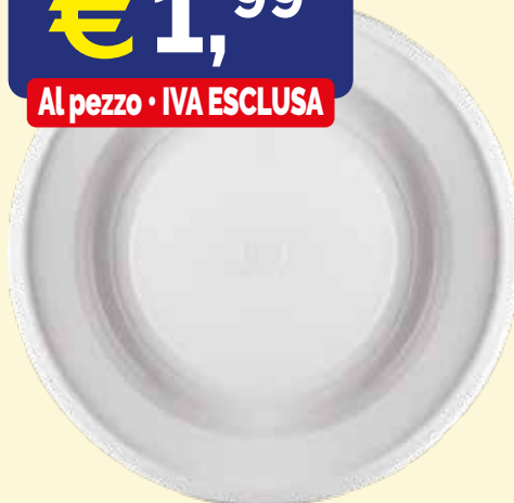
PIATTO TONDO FONDO IN POLPA DI CELLULOSA mm. 170x50 pz.