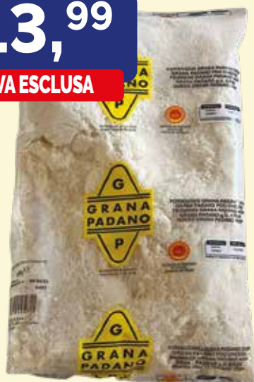
GRANA PADANO DOP GRATTUGIATO busta kg. 1