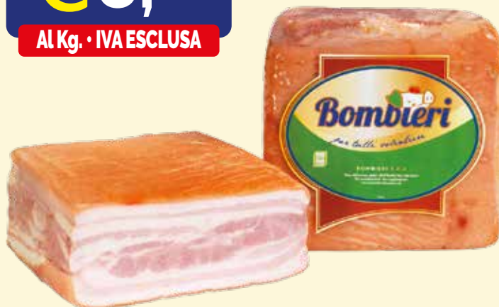
PANCETTA STUFATA DOPPIA E BASSA BOMPIERI kg. 3