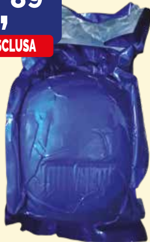
PROSCIUTTO COTTO A COSCIA INTERA BLU BOMBIERI kg. 8