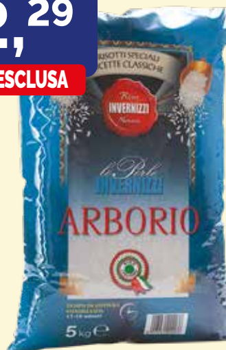
RISO ARBORIO INVERNIZZI busta Kg. 5X3