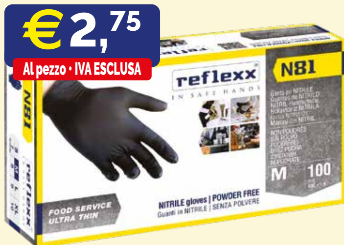
GUANTI MONOUSO IN NITRILE REFLEXX N81 MEDIUM NERE 100 pezzi