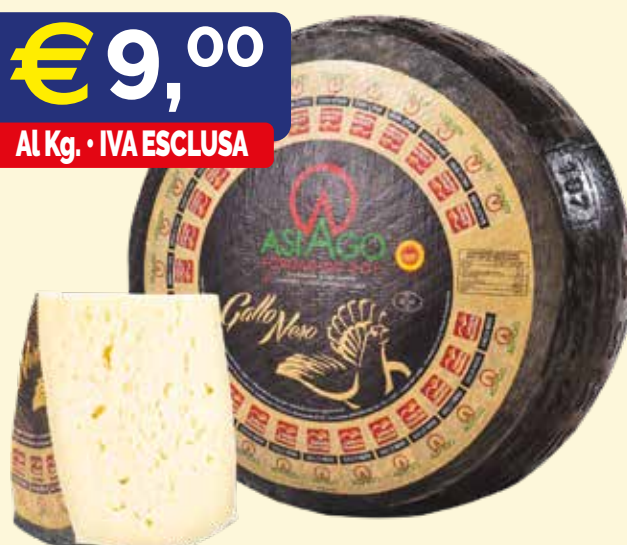
ASIAGO DOP INTERO NERO kg. 12