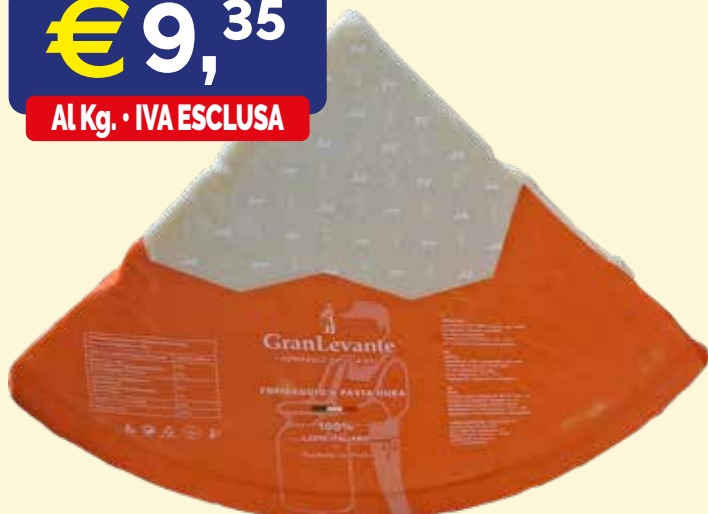
FORMAGGIO A PASTA DURA ITALIANO MANTUANELLA sotto vuoto kg. 4