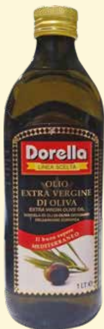
OLIO EXTRA VERGINE D'OLIVA DORELLA lt. 1