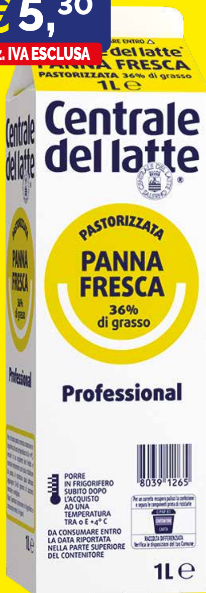
PANNA FRESCA 36/38% CENTRALE DEL LATTE SALERNO lt. 1