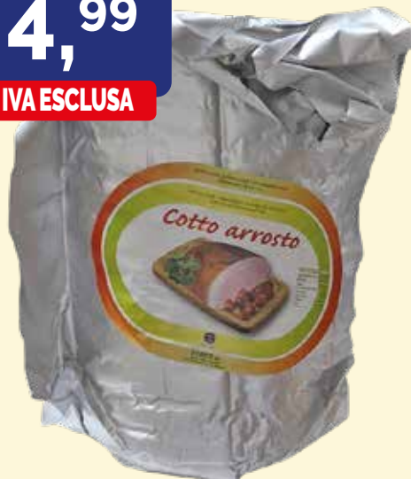
SPALLA COTTO ARROSTO ZAMPINI kg. 8