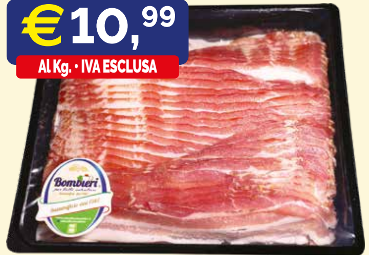
PANCETTA TESA AFFUMICATA AFFETTATA BOMPIERI