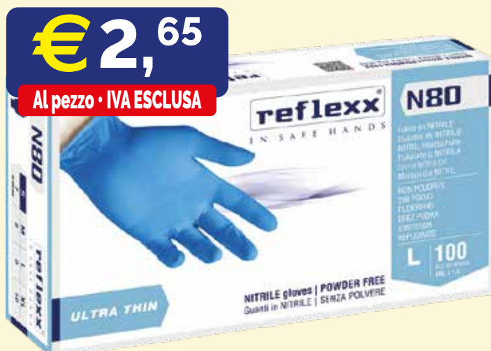
GUANTI MONOUSO IN NITRILE REFLEXX N80B LARGE 100 pezzi