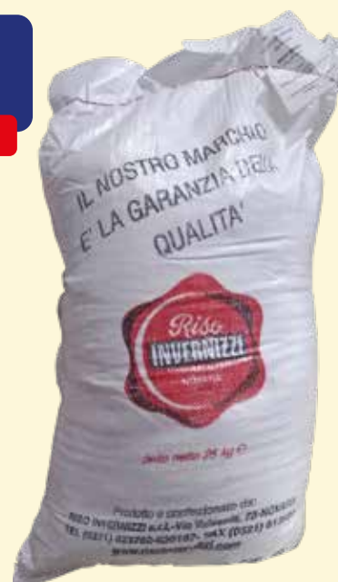
RISO ROMA INVERNIZZI sacco da Kg. 25