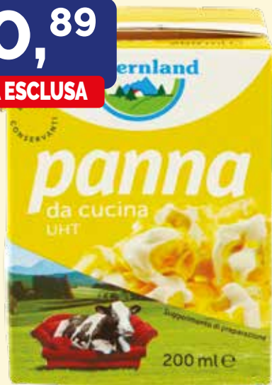
PANNA DA CUCINA UHT BAYERNLAND ml. 200