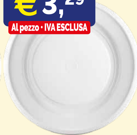
PIATTO PIANO IN POLPA DI CELLULOSA FLORIDA mm. 230x20 pz.