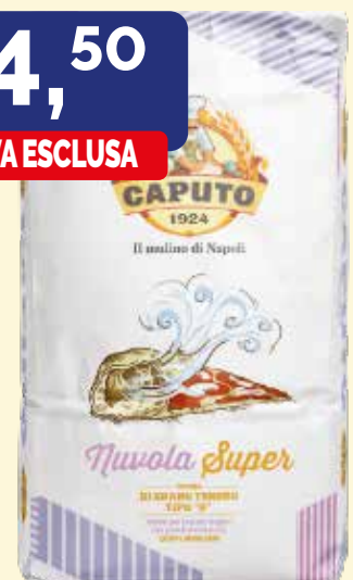
DI GRANO TENERO "0" SUPER NUVOLO W 340 CAPUTO conf. da kg. 25