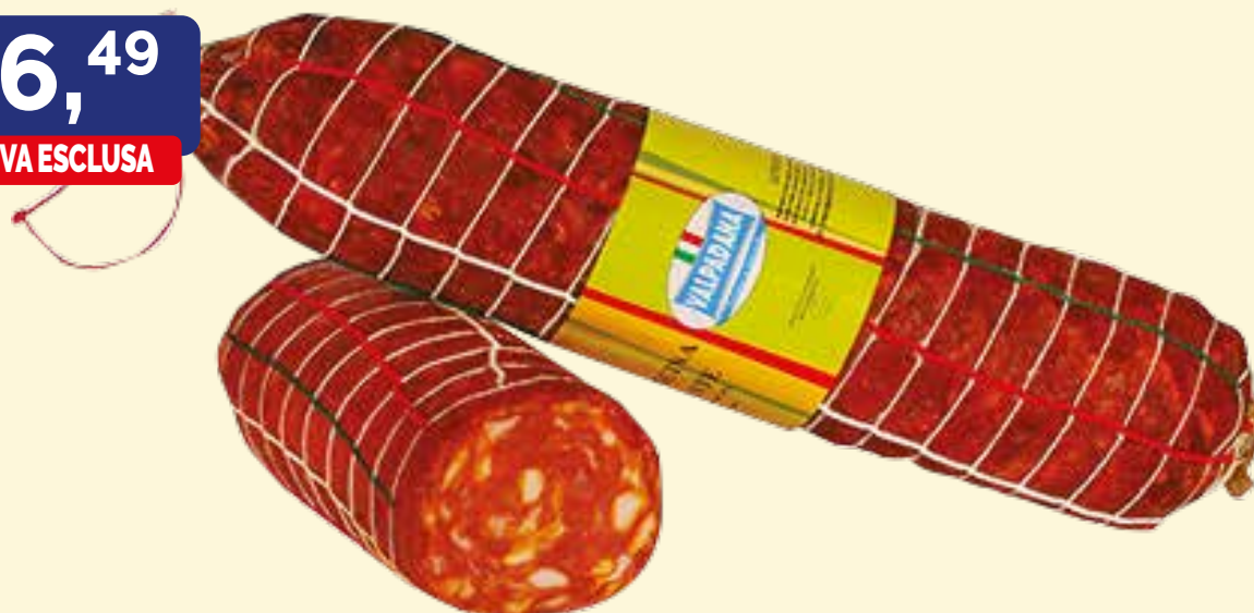
VENTRICINA PICCANTE VALPADANA kg. 3