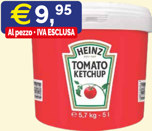
SECCHIELLO TOMATO HEINZ secchiello kg. 5,7