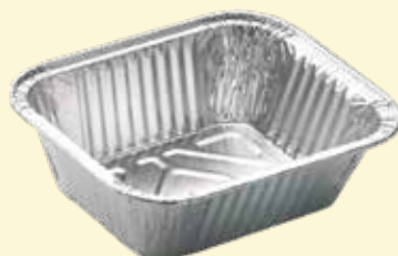
VASCHETTA IN ALLUMINIO 1 PORZIONE 100 pz.