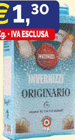
RISO ORIGINARIO INVERNIZZI busta Kg 1x10