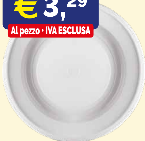
PIATTO TONDO FONDO IN POLPA DI CELLULOSA FLORIDA mm. 230x20 pz.