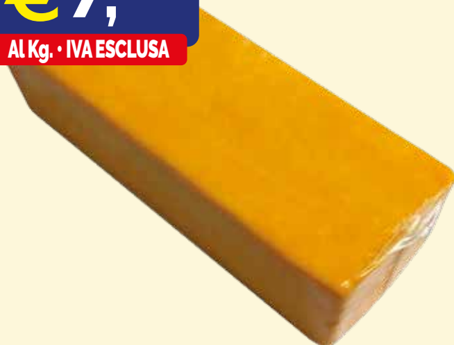
CHEDDAR A FILONE BAYERNLAND