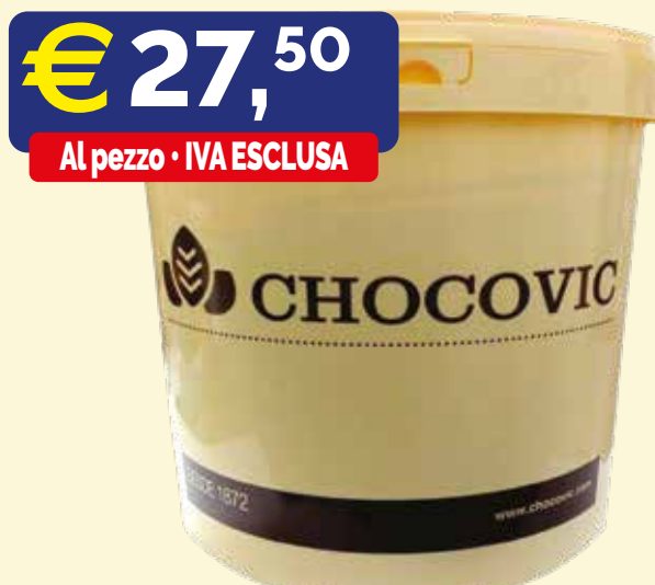
CREMA FARCITURA ALLA NOCCIOLA Secchio kg.10