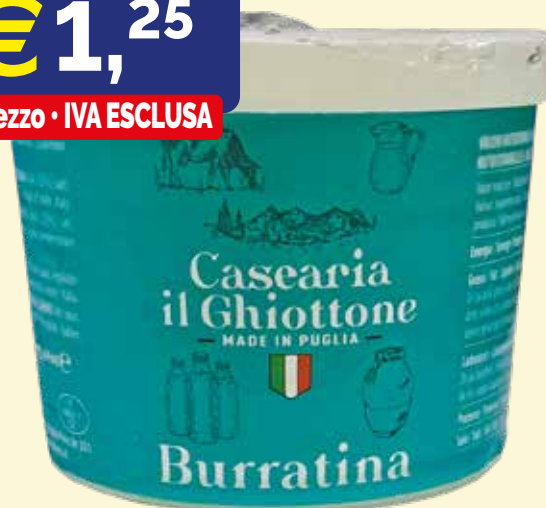
BURRATINA CASEARIA IL GHIOTTONE gr. 125