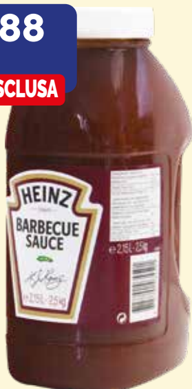
BARBECUE SAUCE HEINZ