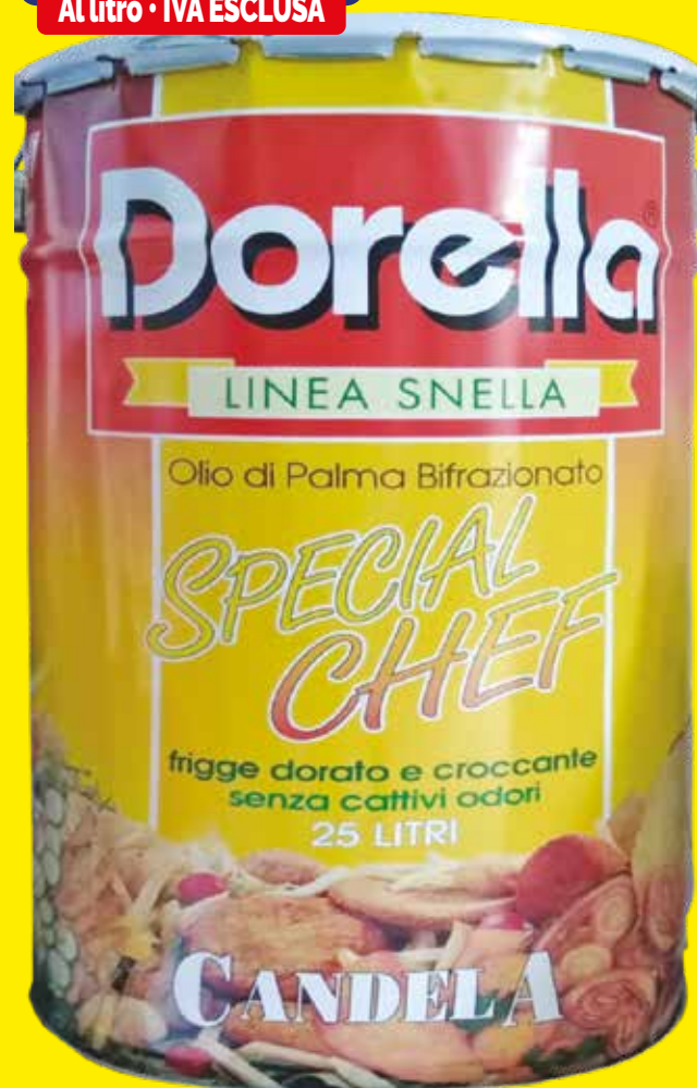
OLIO DI PALMA BIFRAZIONATO Dorella latta da 25 lt