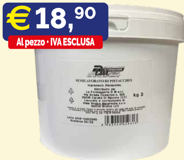
PASTA DI PISTACCHIO NATURALE 100% PURO "LA FORMAGGERIA DM" Secchio kg.3