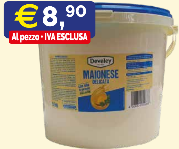
MAIONESE DELICATA DEVELEY CON OLIO DI GIRASOLE SENZA GLUTINE secchiello kg. 5