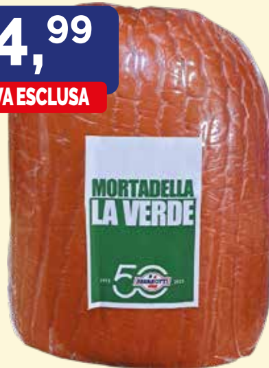
MORTADELLA LA VERDE PAVAROTTI kg. 5