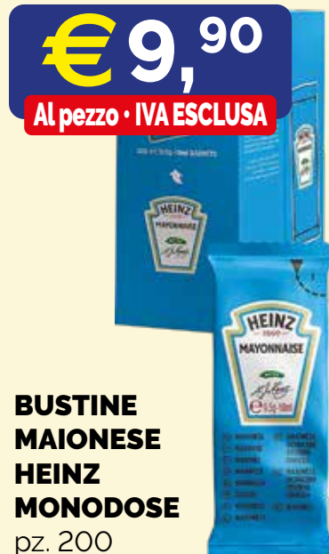
BUSTINE MAIONESE HEINZ MONODOSE pz. 200