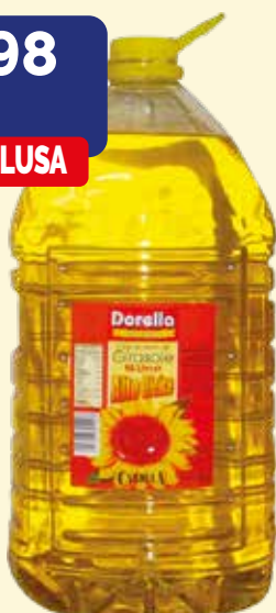
OLIO DI SEMI ALTO OLEICO DI GIRASOLE DORELLA bidone da 10 lt