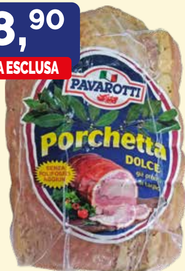
PORCHETTA A METÀ PAVAROTTI kg. 8/9