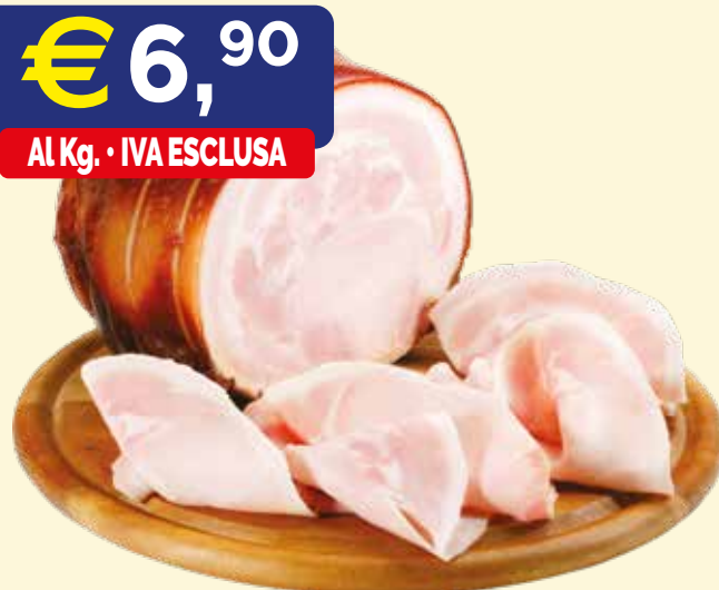
PORCHETTA MONTAGNA SENFTER